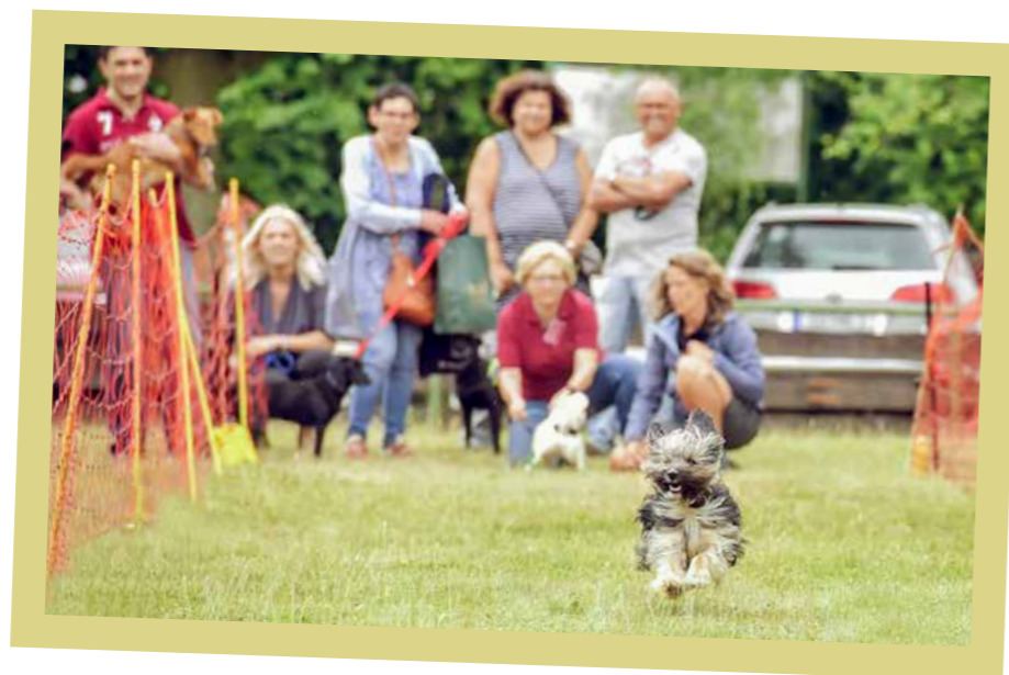
BEIM SOMMERFEST DER FELLFREUNDE IN SOLINGEN HATTEN NICHT NUR FRAUCHEN UND HERRCHEN SPASS